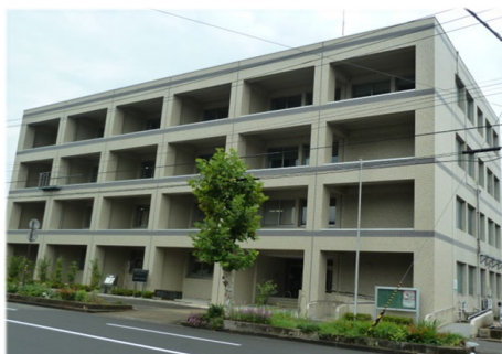
(福井地方合同庁舎)